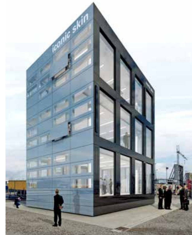
Beeld Susanne Elhardt

Investeren in architectonische specials loont weer, nu ook opdrachtgevers weer wat meer investeren in hun gebouwen, zegt Van der Veen. “De producten van Cladding Point staan bekend als geschikte basis voor architectonische oplossingen met behoud van bouwprestaties. En wij presenteren onszelf graag als innovator van de gebouwschil. Dat heeft zijn wortels in onze samenwerking met fabrikanten als Brucha en Voestalpine, bedrijven verankerd in de hoogwaardige maakindustrie. Vorig jaar introduceerden wij ons exclusief dealership van Bacacier by S+arck®, een modulair opbouwstelsel voor de gevelafwerking met een grote ontwerpvrijheid - gecombineerd met de high end Alpha Design+ 3S carrier sandwichpanelen van Cladding Point; nu kunnen wij opnieuw een premium afwerkingsproduct aan de catalogus toevoegen: iconic skin GSP, ontwikkeld door de Duitse gevelbouwer Seele.”