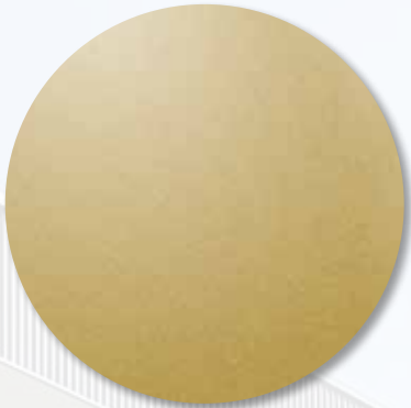
INSPIRED BY NATURE