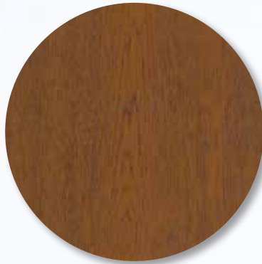
INSPIRED BY WOOD