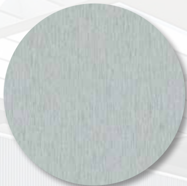
INSPIRED BY TECHNOLOGY