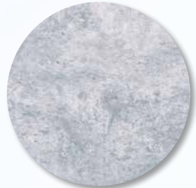
INSPIRED BY ART